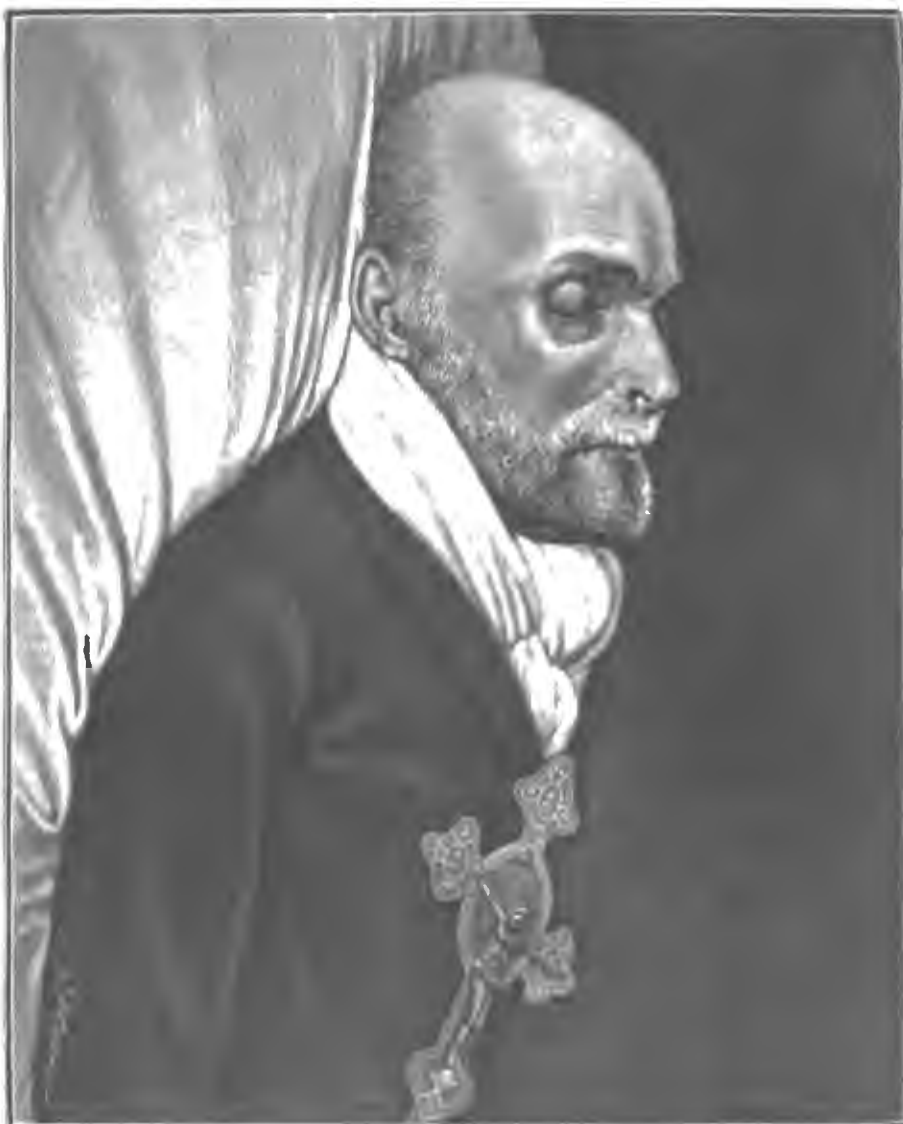
НИКОЛАЙ ИВАНОВИЧЪ ПИРГОВЪ 23-го НОЯБРЯ 1881 Г.