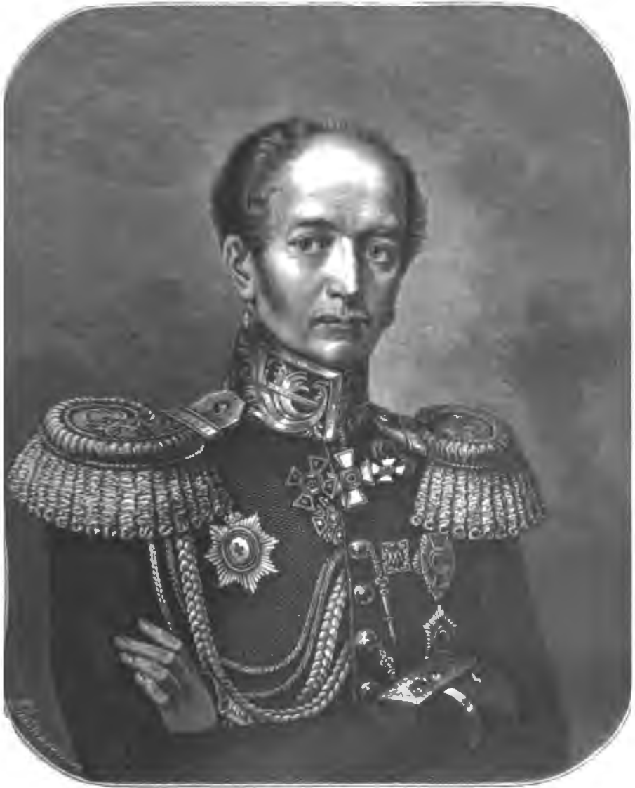
КАРЛЪ КАРЛОВИЧЪ МЕРДЕРЪ, ВОСПИТАТЕЛЬ ЦЕСАРЕВИЧА АЛЕКСАНДРА НИКОЛАЕВИЧА ВЪ 1824 — 1834 ГГ.